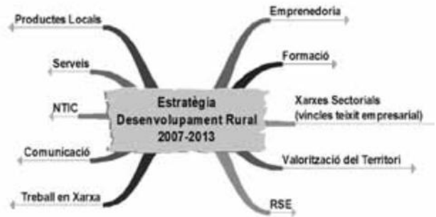
Fig 4 – Eixos a incidir de l'Estratègia d'ADRINOC

Els eixos a incidir amb aquesta estratègia per assolir el seu objectiu són: (fig. 4)