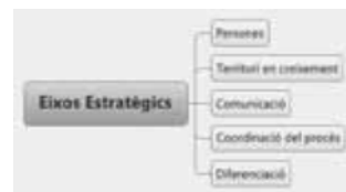
Fig 2 – Eixos estratègics de treball