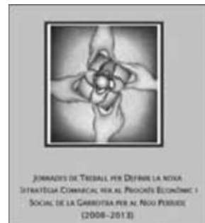
Fig 1 – Il·lustració de les Jornades de treball per definir la Nova Estratègia Comarcal per al Progrés Econòmic i Social de la Garrotxa per al Nou Període (2008-2013)

Partint doncs d'unes diagnòs comarcals existents es va elaborar una primera diagnòs conjunta del nou territori Leader, sorgint-ne un primer DAFO de les zones d'actuació. Seguidament es va fer un procés participatiu a nivell de cada comarca que havia de formar part del nou GAL tot seguint una mateixa metodologia, procés i criteris (definició de 5 eixos estratègics, grups de treball amb experts i professionals públics/privats, ...) per arribar a un nivell de definició d'accions concretes. (fig. 1) (fig. 2)