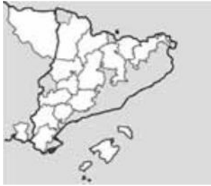
Fig 11 – Mapa dels territoris del projecte de cooperació GSR

Gestió Sostenible Rural (GSR) és un projecte de cooperació interregional impulsat per divuit grups de desenvolupament local de Catalunya, Balears i Aragó que pretén fomentar una nova cultura empresarial en les organitzacions –públiques i privades- del medi rural a través del desenvolupament d'una metodologia comú d'implantació de polítiques de Responsabilitat Social Empresarial (RSE) que garanteixi el seu desenvolupament sostenible i, per extensió, la dels territoris on s'ubiquen.