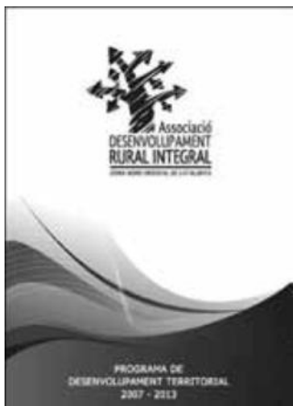
Fig 3 – Il·lustració de l'Estratègia d'ADRINOC, Programa de Desenvolupament Territorial 2007-2013

Es planteja doncs una estratègia que va molt més enllà dels ajuts Leader, que afecta a tots els actors del territori, i que té com a objectiu un posicionament diferenciador com a territori. (fig. 3)