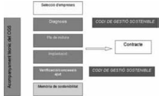
Fig 8 – Procés d'implantació RSE

Això s'aconsegueix aplicant la metodologia del Codi de Gestió Sostenible lligada als ajuts públics Leader. D'aquesta manera, l'obtenció d'ajuts Leader gestionats per ADRINOC està condicionada al desenvolupament d'un conjunt d'actuacions per millorar la gestió de l'empresa en els àmbits econòmic, mediambiental i social. Aquest procediment a seguir es desenvolupa de forma paral·lela a la realització de la inversió per la qual s'ha sol·licitat l'ajut. (fig. 8) (fig. 9)